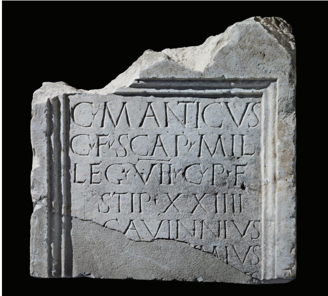
Sl. 2 - Abb.2 : Stela Gaja Mantika, vojnika VII. legije Claudia pia fidelis = Grabstele des Caius Manticus, mil(es) leg(ionis) VII Claudiae piae fidelis (Arheološki muzej u Splitu, inv. br. A 3150).

nalazišta u Dalmaciji uklapaju u sliku koju o Klaudijevom razdoblju imamo na području uz Rajnu i Dunav. Za razliku od natpisa, u Tiluriju se do sada istražene spavaonice, zahvaljujući pokretnim nalazima i stratigrafskim odnosima mogu datirati tek u Klaudijevo razdoblje.