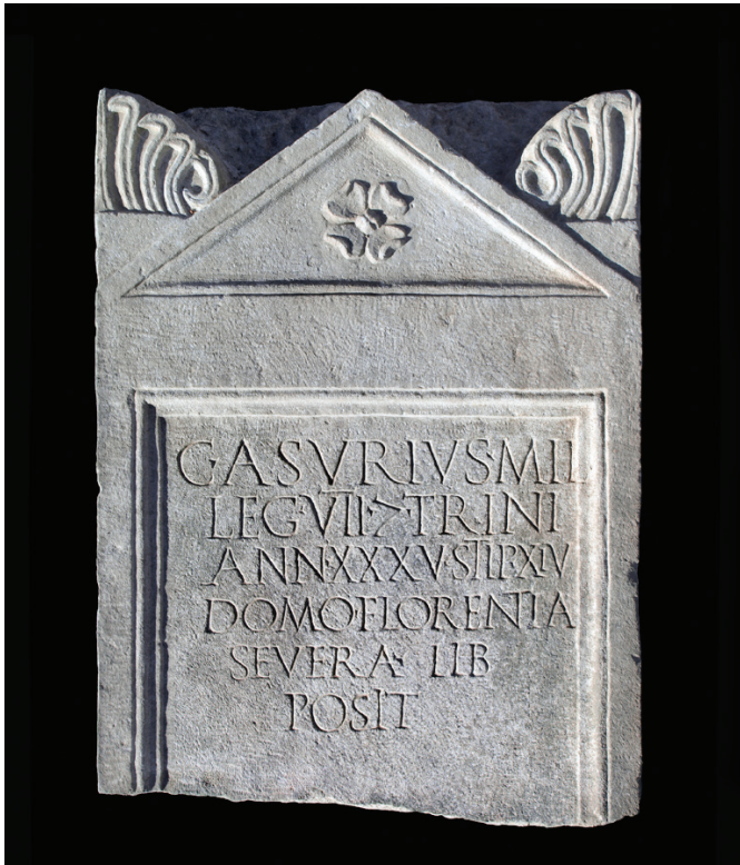
Sl. 1 - Abb. 1: Stela Gaja Asurija, vojnika VII. legije = Grabstele des Caius Asurius, mil(es) leg(ionis) VII (Arheološki muzej u Splitu, inv. br. A 1424).

senatora (Suetonije, August, 38,2), a nakon Klaudijeve reforme za njih su u vojsci preostali zapovjedništvo nad legijom i mjesto legijskog tribuna. (Thomas, 2004, 428–30.)