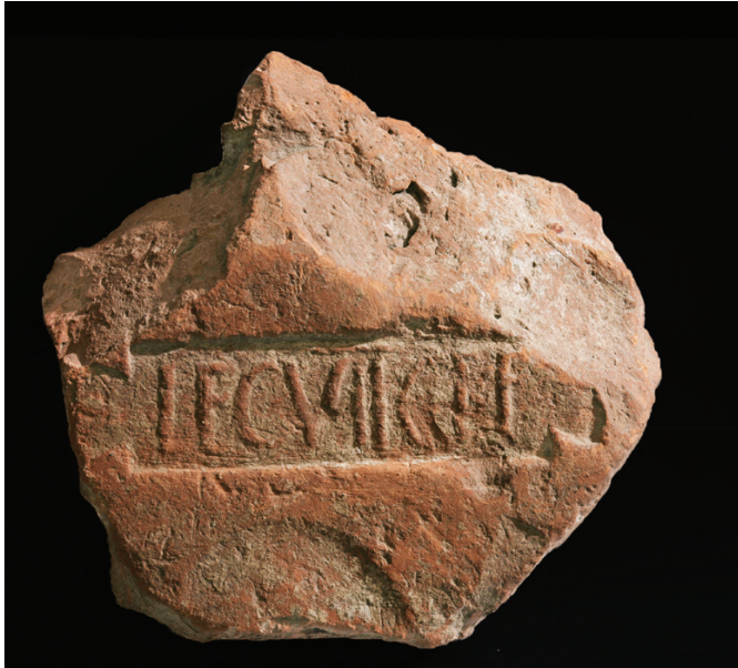
Sl. 3 - Abb.3 : Ulomak tegule s pečatom VII. legije Claudia pia fidelis = Ziegelstempel der leg(ionis) VII Claudiae piae fidelis (Zbirke Franjevačkog samostana u Sinju – Arheološka zbirka, inv. br. RK 48; Foto: A. Verzotti).

Ako se potvrdi postojanje logora pomoćnih postrojbi u Kadinoj Glavici i njegova datacija u vrijeme Klaudija, to bi mogao biti pokazatelj izdvajanja pomoćnih postrojbi u zasebne logore već na tzv. Delmatskom limesu u Dalmaciji.