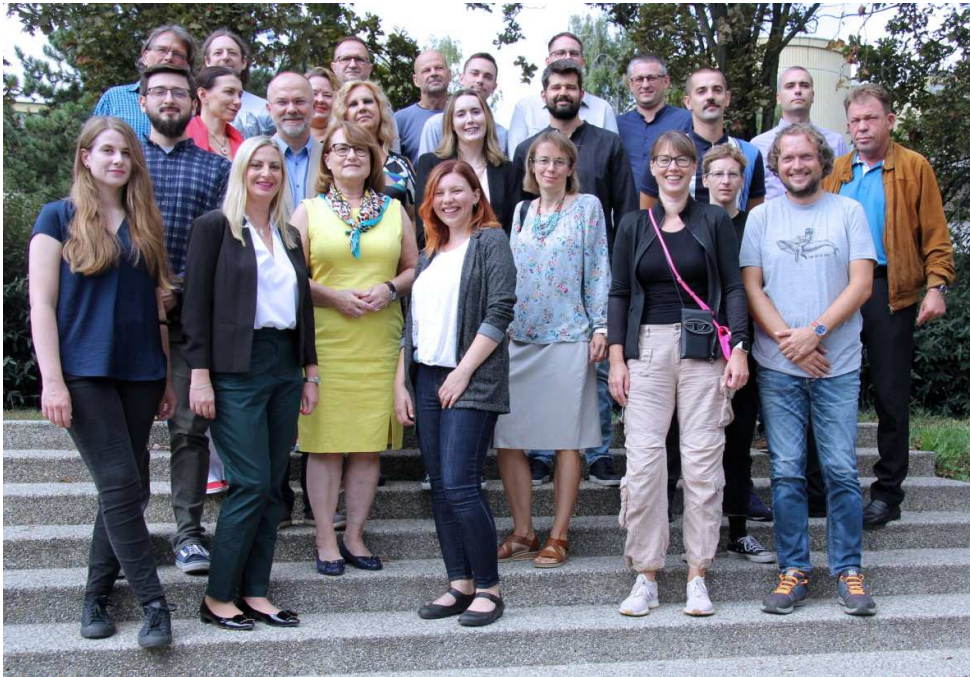
Naš radni kolektiv. Prema rezultatima istraživanja radnih karijera FFZG alumna koje je provedeno 2021., zapošljivost mag. soc. je izrazito velika: 96% alumna studija sociologije se unutar pet godina od završetka studija zaposlilo, u velikoj većini slučajeva na ugovor o radu na neodređeno na kvalitetnim radnim mjestima s kojima su bili zadovoljni. Oko 25% magistara sociologije zapošljava se u obrazovanju, a po otprilike 15% u stručnim, znanstvenim i tehničkim djelatnostima te u sektoru informacija i komunikacija.